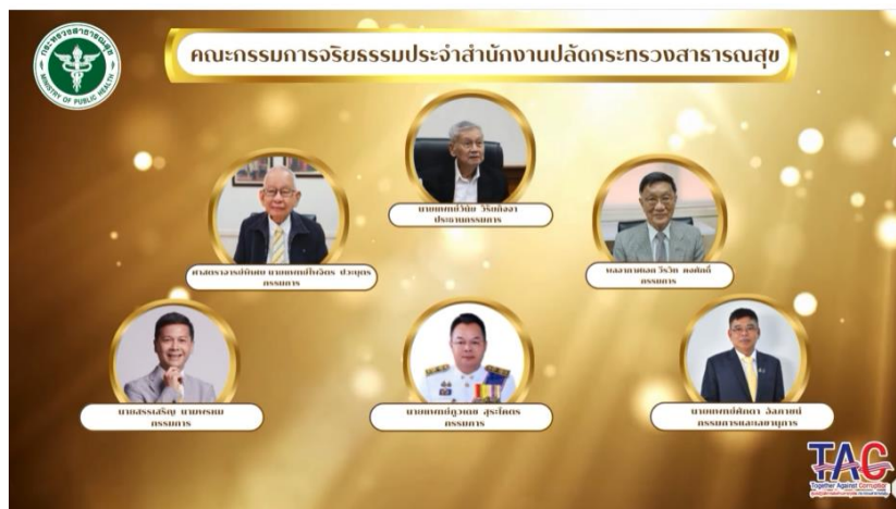
คณะกรรมการจริยธรรมประจำสำนักงานปลัดกระทรวงสาธารณสุข ประจำ